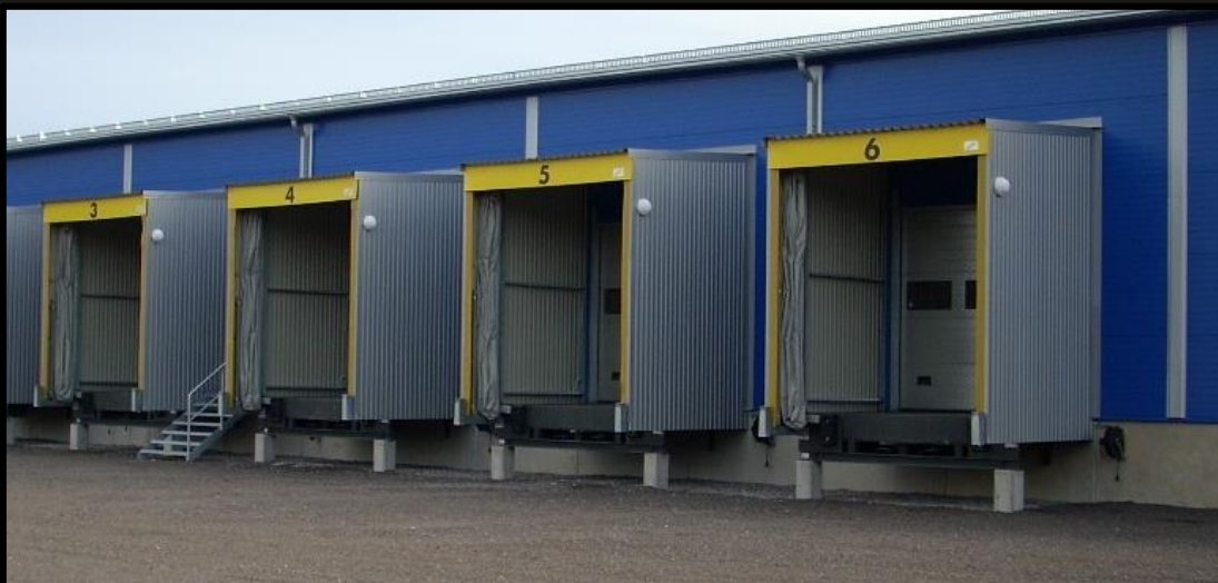
UBS 2400-vädertätningar monterade på lasthus

Om en lastbil skulle köra iväg utan att vädertätningen stängts av så följer säckarna och duken med lastbilen tack vare att skenor är elastiskt upphängda i ramverket.